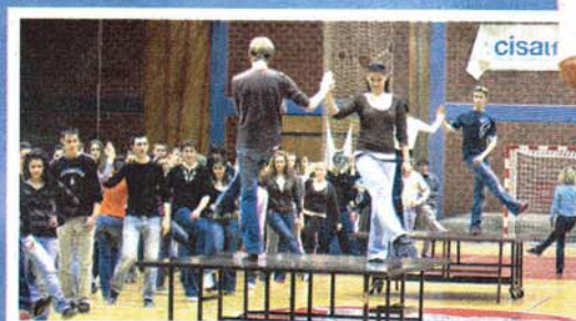
NA STRANICI www.ps-spin.hr maturanti mogu naći kratki video pomoću kojeg mogu ponoviti korake

nata u 36 gradova Slovenije, Austrije, Mađarske, Srbije, a iz Hrvatske prošle se godine plesalo u Osijeku, Bjelovaru, Metkoviću i još nekim manjim gradovima. Ove godine prvi će put plesati i zagrebački maturanti. Očekujemo da će ove godine ukupno plesati 30.000 maturanata." Za maturante koji će ove godine prvi put plesati Četvorku pripreme se održavaju već nekoliko mjeseci, na deset lokacija koje je osigurao Grad, pod nadzorom 20-ak plesnih voditelja, a poduka koja traje tjedan dana za sve je polaznike besplatna. Valdec o planovima za 18. svibnja kaže: "Maturanti će se okupiti oko 9 sati na Trgu Franje Tuđmana gdje ćemo ih registrirati kako bismo znali broj sudionika.