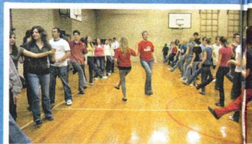
PLESNE PROBE održavaju se na nekoliko lokacija koje je osigurao Grad Zagreb pod nadzorom 20-ak plesnih voditelja