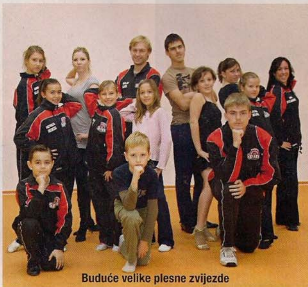
Buduće velike plesne zvijezde

Dm Dance Grand Prix 2007, u organizaciji Plesnog studija Spin i pod pokroviteljstvom dm-a, održat će se u subotu 24. studenoga u ŠD Trešnjevka (Kutija šibica), s početkom u 12 sati, dok je finale u 19 sati. Riječ je o međunarodnom HŠPS bodovnom turniru u standardnim i latinsko-američkim plesovima, a očekuje se nastup gotovo 300 plesnih parova iz Hrvatske i još desetak europskih zemalja. Ulaznice se mogu kupiti od 19. do 24. studenoga na blagajni Kutije šibica od 16 do 19 sati.